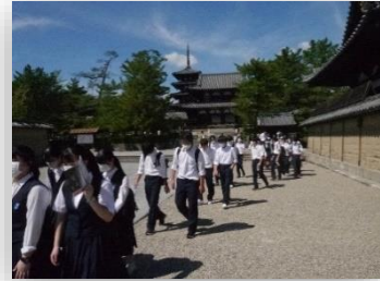
< 3年奈良・京都修学旅行 >