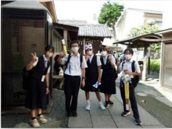
< 1年川越校外学習 >

3年生にとって、初めての宿泊行事となり学校では学べない思い出に残る行事となりました。2年生は浅草方面に、1年生は川越で、それぞれ班行動で生徒自ら計画した見学地を訪問しました。現在、事後学習として学習の成果を、ICT（パワーポイント）を用いて発表する準備を進めています。