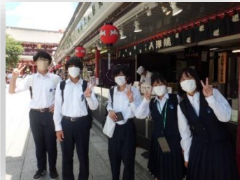
< 2年東京校外学習 >