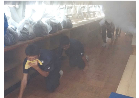
煙の中を進む、煙体験