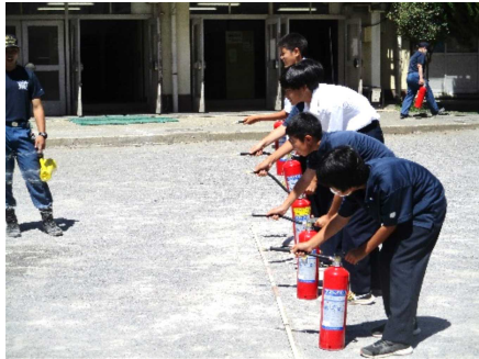
水消火器による初期消火訓練

実際に災害が起きた時に被害を最小限に食い止めるためには、日頃からの防災に対する準備が大切になります。今回の訓練では、水消火器を使って初期消火について学んだり、AEDを利用しながら心肺蘇生法を学んだり、いざというときに慌てずに行動ができるようになるために、実践的な訓練が行われました。これからも、命を守る適切な行動がとれるように学校として様々なことに取り組んでいきます。