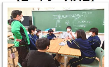
【新入生部活動体験 (I組部)】