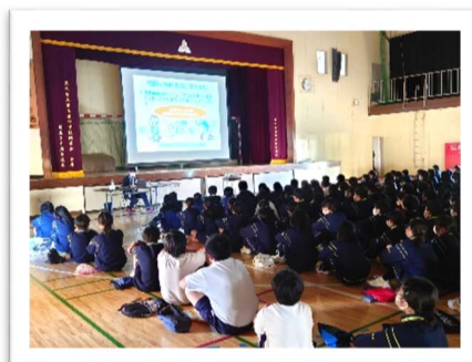
【薬物乱用防止教室 (1年)】