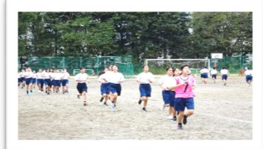
【ロードレース大会】