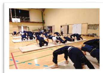
【保健体育 (2年マット運動)】